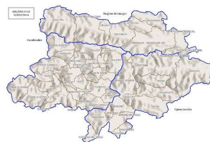
L’Area transfrontaliera HEurOpen

http://www.euroleader.it/in-primo-piano/heuroopen-proroga-termini-presentazione-progetti-piccoli-e-medi